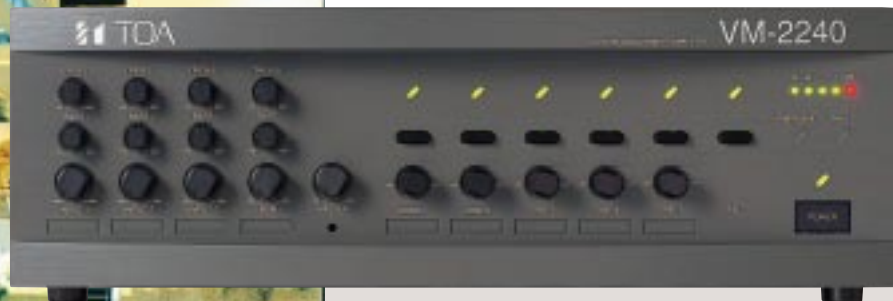
VM-2120: 120W Systemverstärker VM-2240: 240W Systemverstärker