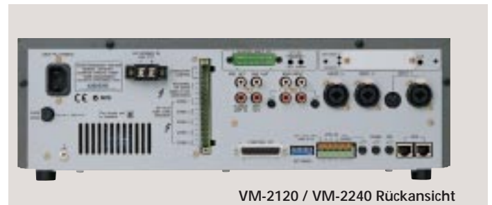
VM-2120 / VM-2240 Rückansicht

Neben normalen Durchsagen in wählbare Bereiche ermöglicht die Systemsprechstelle RM-200M auch live gesprochene oder vom Textspeicher abgerufene Notfallmeldungen in alle Bereiche. Des Weiteren lassen sich 5 gespeicherte Texte (z.B. Werbetrailler) individuell in die Bereiche absetzen. Bei zwei verkoppelten Verstärkern stehen 10 wählbare Bereiche zur Verfügung. Die Tastaturerweiterung RM-210 ermöglicht den Zugriff auf Texte des Textspeichers, wenn zwei Verstärker verkoppelt und das Textspeichermodul eingebaut sind. Bis zu vier Systemsprechstellen können mit bis zu 800 Metern Leitung an einen System Management Verstärker angeschlossen werden.